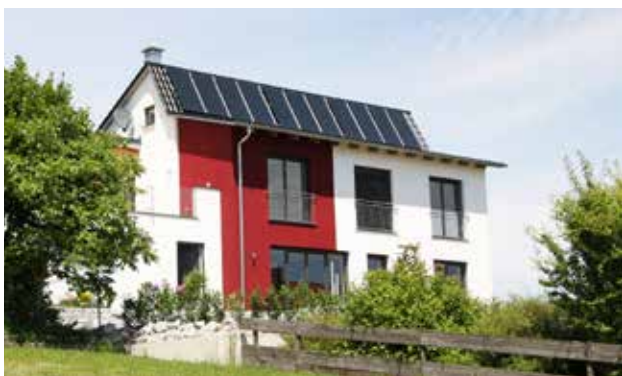
Sur toiture ou sur imposition